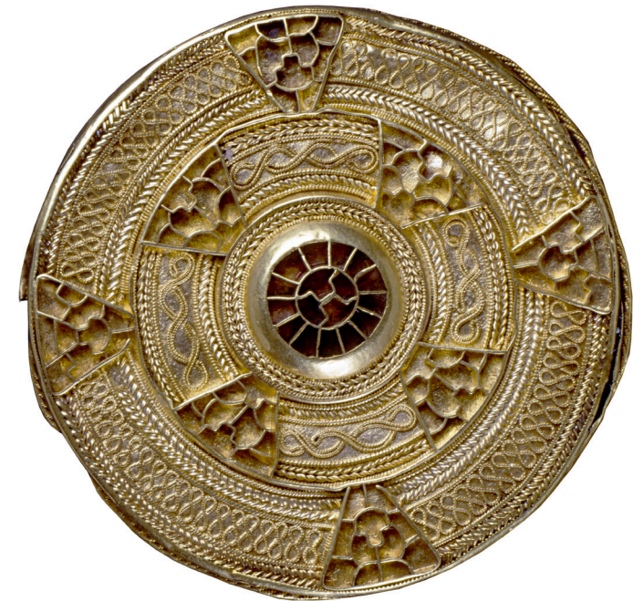
Goldscheibenfibel, 6. Jhd. n. Chr., Lauchheim (ALM)

Förderverein Archäologisches Landesmuseum Baden-Württemberg e.V.